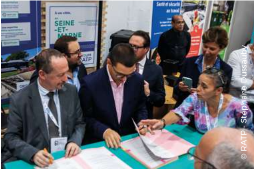
Signature d'une convention de partenariat avec la Mission Locale Paris-Vallée de la Marne en 2023.