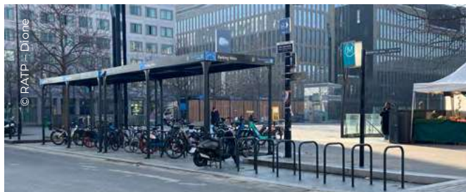
Places en libre-accès à la station de métro Front Populaire

Le groupe RATP accompagne son développement massif en Île-de-France: près de 6000 places de stationnement vélo sont désormais accessibles aux abords des gares et stations exploitées par la RATP.