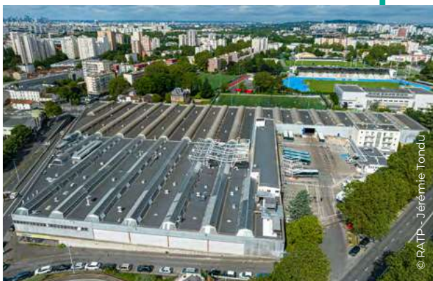
Centre bus de Saint-Denis - Panneaux photovoltaïques en toiture

Aujourd'hui, le groupe RATP est le premier collecteur d'eaux d'exhaure en Île-de-France avec plus de 9 millions de m 3 récupérés chaque année. Notre enjeu est de valoriser cette ressource en collaborant notamment avec d'autres acteurs du territoire. A titre d'exemple, une expérimentation pour créer un démonstrateur de réemploi des eaux d'exhaure est en cours de montage avec la régie d'Est Ensemble et la ville de Bobigny.