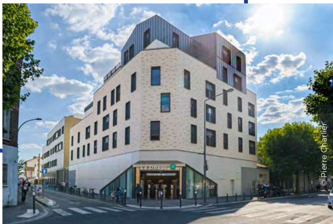
RATP Habitat - réalisation de 19 logements sociaux au-dessus de la station La Dhuis (L11)