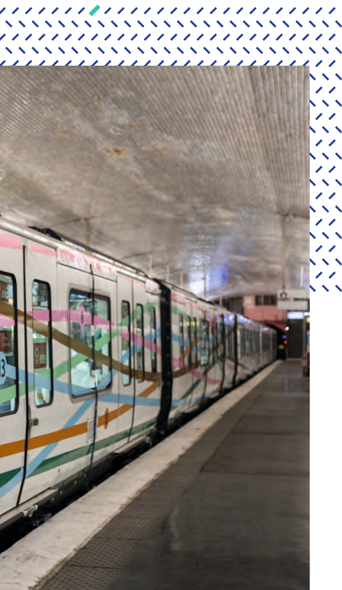
Sur la ligne 6, une rame MP73 et une rame MP89.