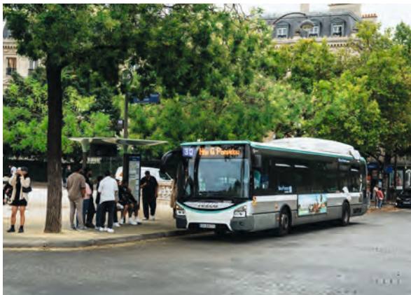
📍 Véhicule hybride, au cœur de la capitale.

À fin 2025, 10 centres opérationnels bus franciliens avaient été convertis à l'électrique et 12 au biométhane.