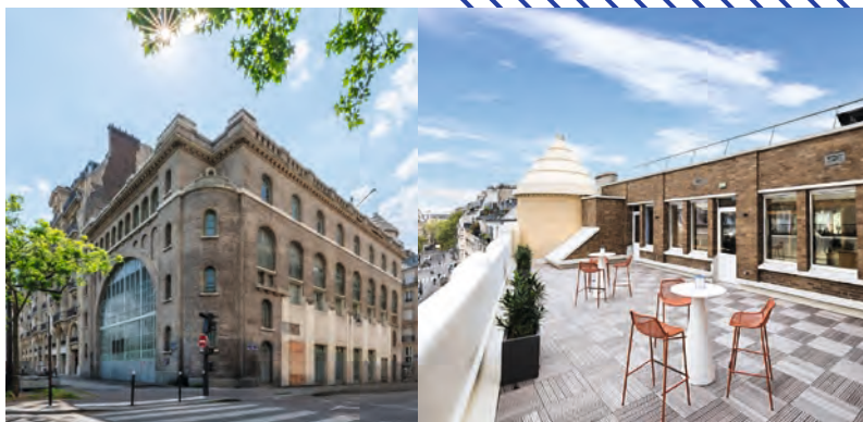
Site événementiel situé au-dessus de la sous-station électrique de Bastille.

Portée par RATP Real Estate, la marque Urban Station réinvente des lieux existants pour créer des espaces fonctionnels, conviviaux, adaptés aux nouveaux modes de travail et de haute qualité architecturale en région parisienne. Sa dynamique s'est accélérée en 2025 avec l'ouverture d'un espace de bureaux opérés dans le quartier Daumesnil, prélude à la mise en service de trois sites événementiels dans d'anciennes sous-stations électriques de la RATP à Bastille, Auteuil et sur l'Île de la Cité. Le réemploi, la réutilisation et le recyclage changent également d'échelle au sein du Groupe grâce à Quai des Ressources, la plateforme numérique qui donne une seconde vie au matériel professionnel de la RATP. Depuis le lancement de ce service en novembre 2024, 77 tonnes de matériaux (carrelage, mobiliers tertiaires et industriels, équipements divers, etc.) ont été détournées des filières déchets.