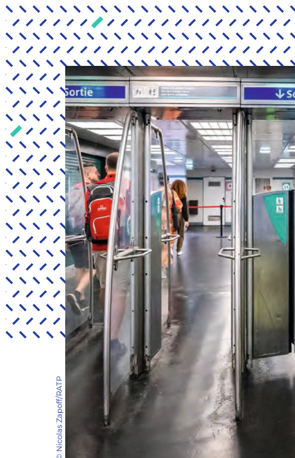
↑ Techniciens de maintenance en intervention.

154 personnes en situation de handicap ont été recrutées sur les 3 dernières années couvertes par le 9 e accord RATP en faveur de l'emploi des personnes en situation de handicap (2023-2025). Un chiffre supérieur à l'objectif de 105 recrutements !