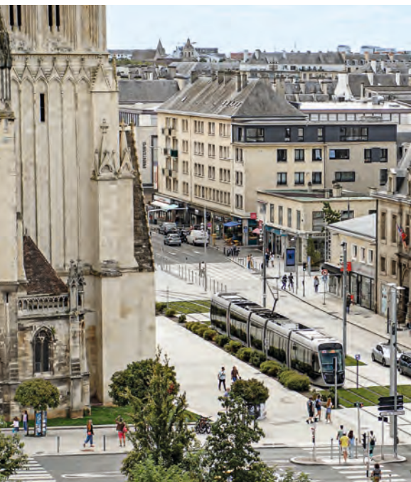
↪ Tramway à Caen.