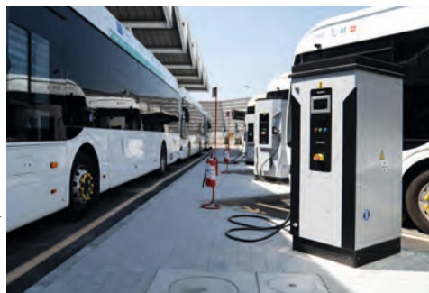
⤴ Station de recharge électrique pour Bus, en Toscane, en Italie.