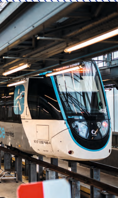
↪ Entretien et maintenance du tram T12.

En 2027, 14 lignes prévues en exploitation dans le monde : un chiffre qui en dit long sur l’expertise du Groupe dans les systèmes de métro automatique. L’année 2025 lui a permis d’accentuer sa présence en Australie. Déjà attributaire en 2022 du marché pour l’exploitation et la maintenance de la future ligne Sydney Metro – Western Sydney Airport avec le consortium Parklife Metro, RATP Dev a remporté, en décembre 2025, le contrat de la ligne Suburban Rail Loop East à Melbourne, au sein de la Linewide Alliance. Dans le cadre de ce nouveau projet, dont la mise en service est attendue pour 2035, RATP Dev apportera son expertise de futur exploitant de la ligne (conseil amont) avant d’en assurer l’opération et la maintenance, aux côtés de John Holland, dans le cadre d’une concession de quinze ans.