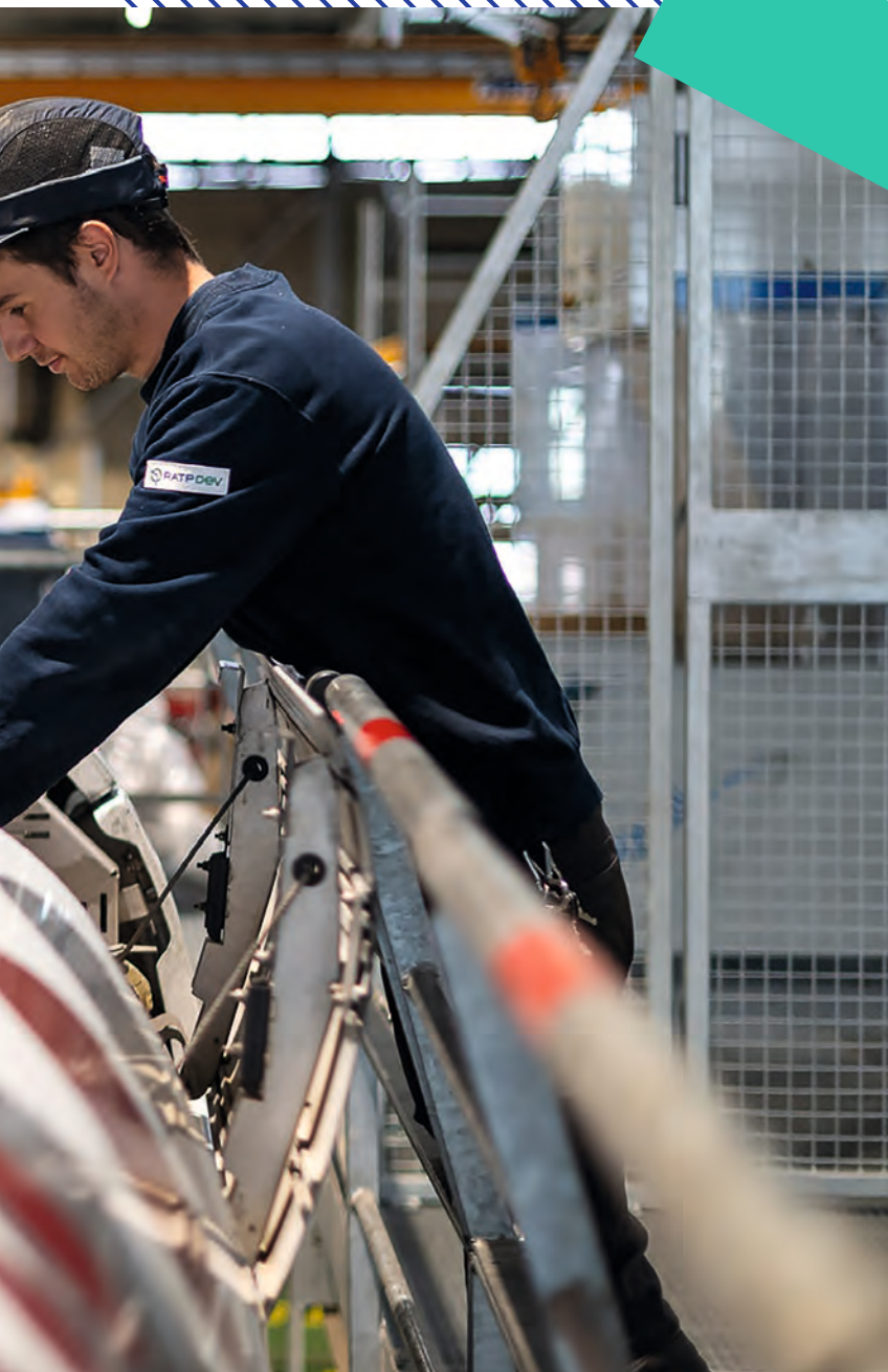
📍 Atelier de maintenance à Lyon.