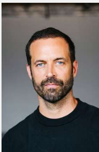
Benjamin Millepied

Benjamin Millepied est un chorégraphe, metteur en scène et ancien danseur étoile du New York City Ballet, reconnu internationalement. Il a créé des œuvres pour les plus grandes compagnies du monde, telles que le Ballet de l'Opéra de Paris, le Ballet du Mariinsky, ou encore le San Francisco Ballet.