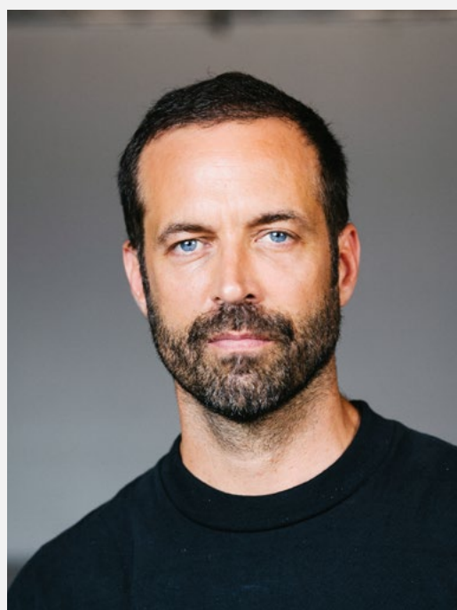
Benjamin Millepied